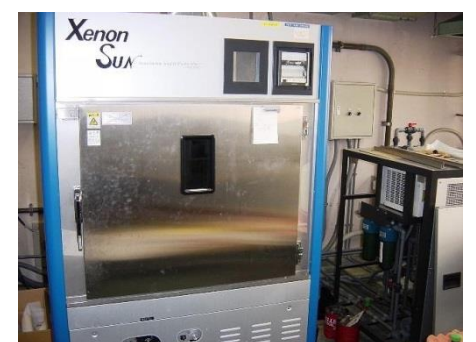
耐候試験機 (720円/時間)