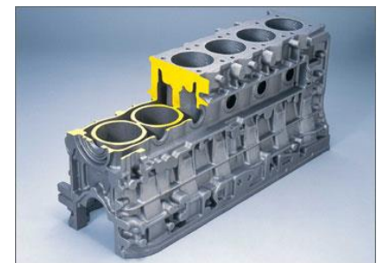
<観察1> 左：繊維品及び繊維材料、右：鋳造品