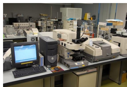
顕微FT-IRラマンシステム (7,600円/時間)