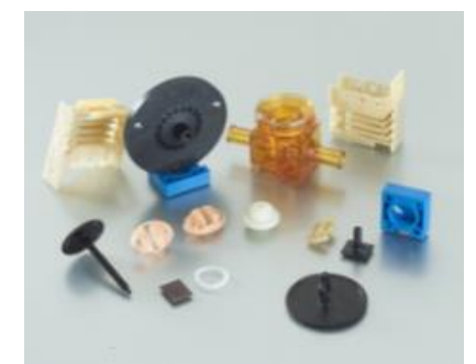
<観察2> 左：自動車部品、右：プラスチック部品