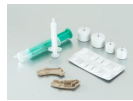
<観察3> 左：電機・電子部品、右：医療部品